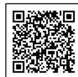
低濃度 PCB 助成金 事務局ホームページ