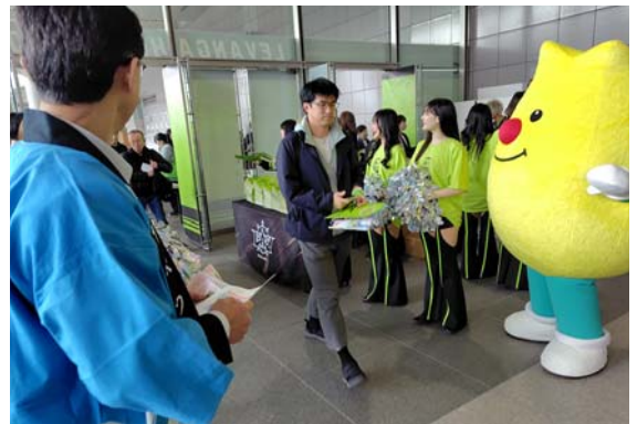
来場者にホタテのソフト貝柱を無料配布し、湧別の魅力をPRしました