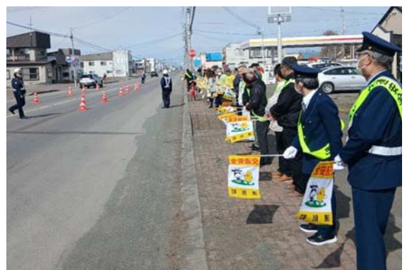
協会会員や交通安全指導員、町内の各事業所の方や自治会など約40人が参加しました