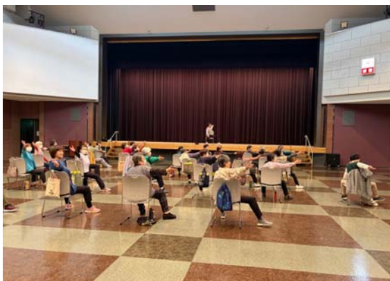
午前・午後合わせて約50の方が参加しました