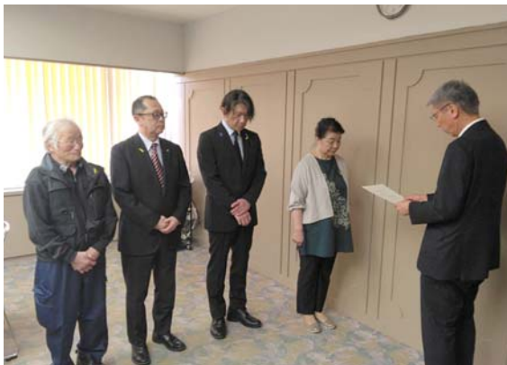
再任された方々に委嘱状が手渡されました