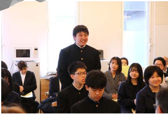
今年度入学した第1期生となる全国各地から集まった11人の新入生とその保護者が出席しました

湧別高校の入学式終了後、学生寮の入寮式が行われました。町長と、寮を運営する(株)47Partnersの横尾代表から歓迎のあいさつがあり、その後、運営スタッフの紹介や、学生寮で生活を共にする学生たちによる自己紹介が行われました。