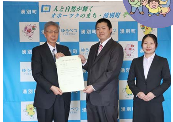
計呂地で就農する上村夫妻