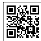
大会ホームページ

専用の郵便振替用紙（コピー不可）に必要事項を記入し、参加料を添えてゆうちょ銀行または郵便局窓口でお申し込みください。ただし、振込手数料がかかります。また、確認用に「振替払込請求書兼受領証」または「ご利用明細票」を大会当日まで保存してください。