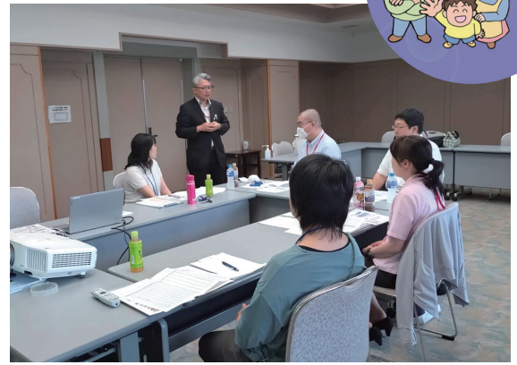
2日間で7人の郵便局職員が受講しました