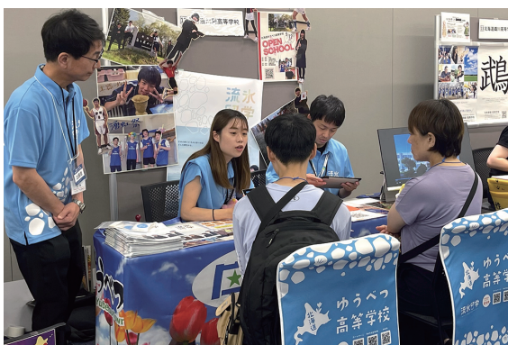
今野校長は、「地元はもとより、他の地域からも湧別高校に来てもらえるようPRに努めます」と話しました