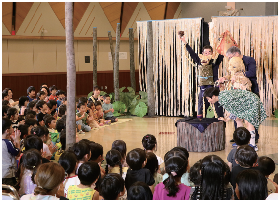
不思議な世界に引き込まれ、夢中で楽しみました