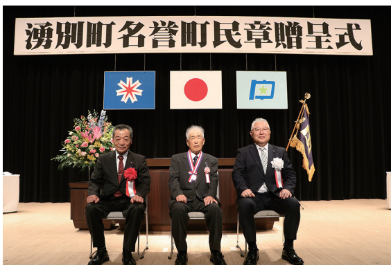
名誉町民の記念章と称号を刻んだ表彰盾が贈呈されました