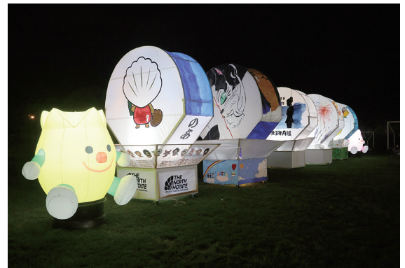
第10回を記念して一般公募されたあんどんが会場を彩り、思い出に残る1日となりました。