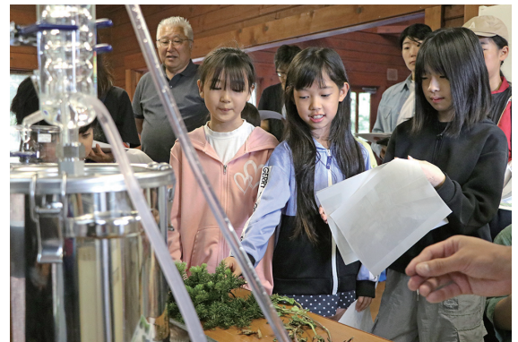
オイルの作製や生木を使ったバターナイフ作成を行いました。