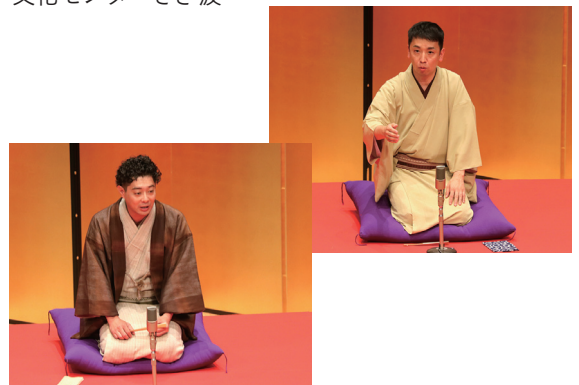
二人の圧倒的な話芸により、会場の観客は引き込まれ、終始大きな盛り上がりを見せました。