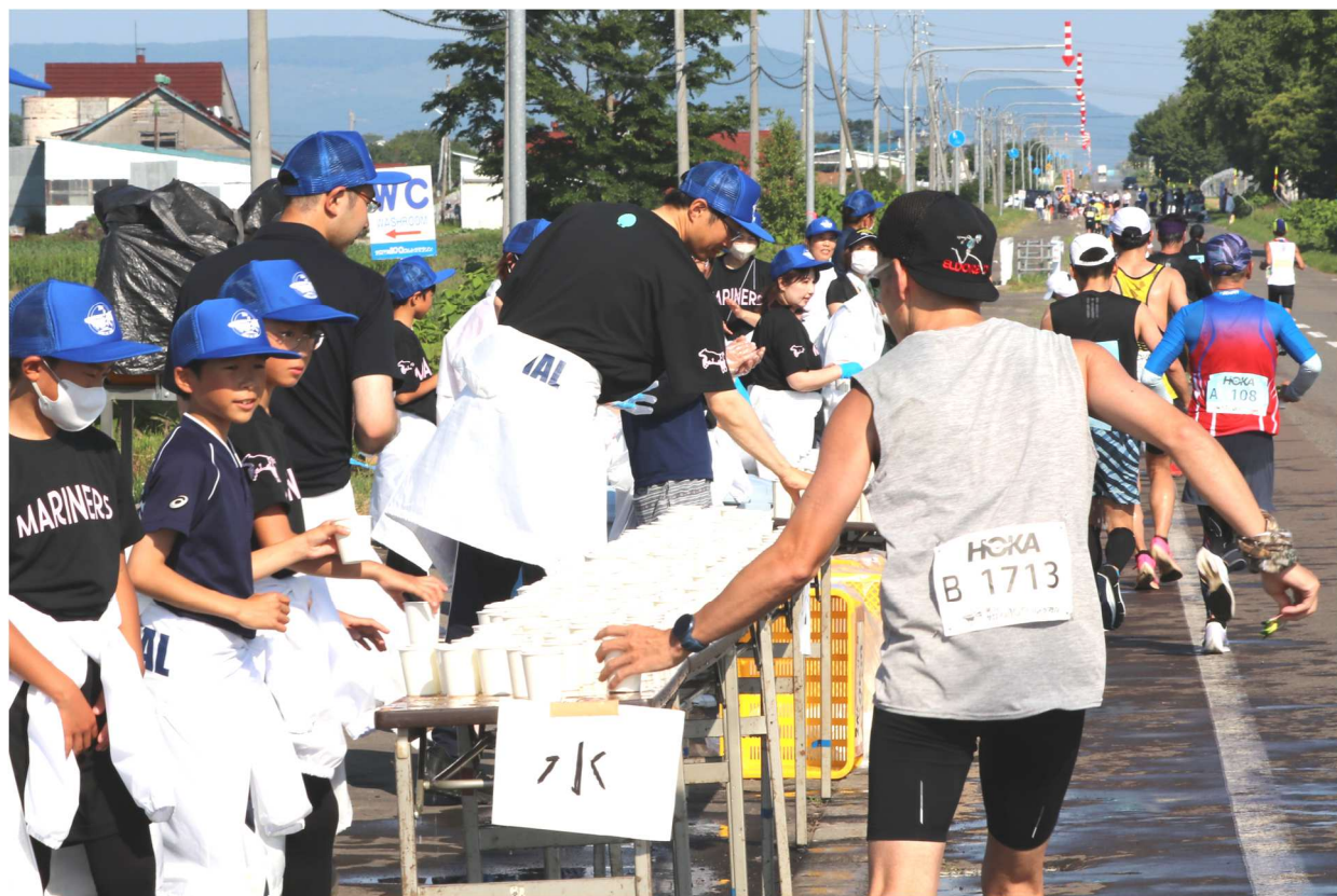
第38回サロマ湖100kmウルトラマラソン大会（R5.6.25 於：湧別町30km給水）