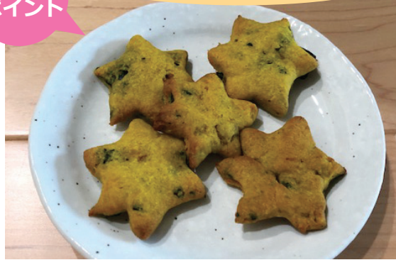
1個分 *エネルギー：48kcal *塩分：0.1g