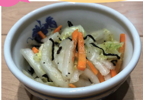
1人分 *エネルギー：30kcal *塩分：0.5g

白菜の代わりにキャベツ、にんじんの代わりにきゅうりやピーマンの千切りでもできます。