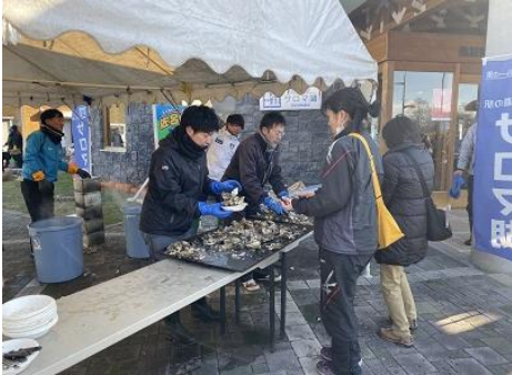
11月17日(日) 佐呂間町道の駅サロマ湖

11月から12月にかけて各漁協主催による「物産まつり」が開催され、特産品の牡蠣をはじめサロマ湖・オホーツク海の新鮮な海産物や加工品などを買い求める多くの来場者でにぎわいました。会場では、食べ放題のイベントもあり来場者は新鮮な味覚を楽しみました。