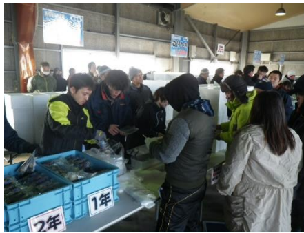
11月23日(祝) 湧別町湧別漁協