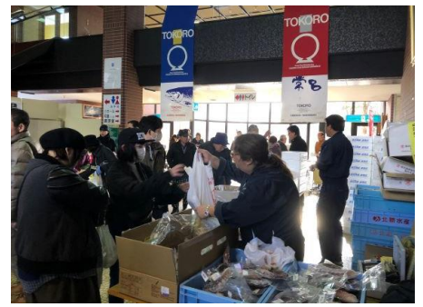
12月8日(日) 常呂町多目的センター