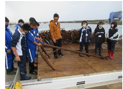
ゆうべつ学(フィールドワーク)