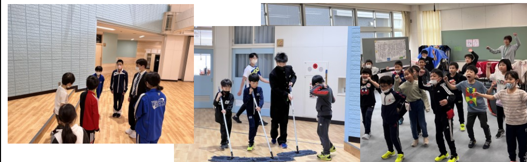
特色ある取組 全校縦割り清掃 1年生から9年生までの班を作り、異学年での清掃活動