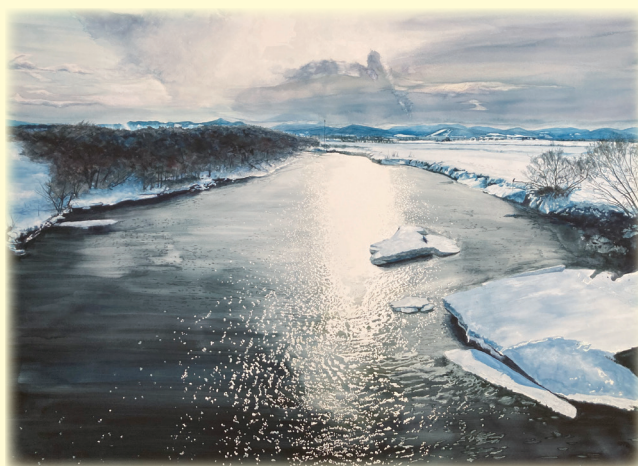
春の雪解けが始まった湧別川を描いた「春光輝(湧別川)」

※受賞作品は、東京・名古屋で展示され、6月に大阪で展示されたのちに、文化センターさざ波で展示される予定です。