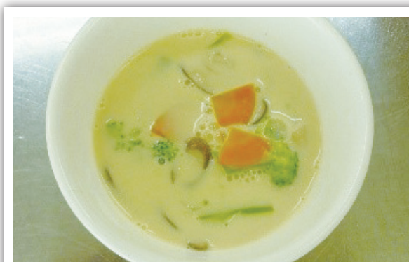
4人分 *エネルギー：95kcal *塩分：1.1g