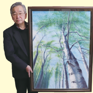
母校の旧湧別小学校体育館横のシラカバを描いた水彩画

ゆうべつ学園開校を記念し、寄贈いただきました。このシラカバのように大きく成長し、優しい思いやりのある人になってほしいという願いが込められています。