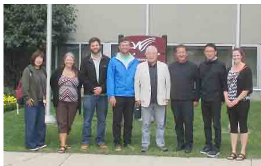
ホワイトコート町庁舎前