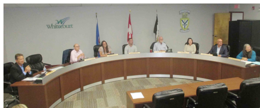
町議会は、町長のほか議会議員6人（うち女性議員2人）で構成されています。

ホストファミリーも同席した歓迎夕食会では、ランクトット副町長から、25年間で多くの方がお互いの文化や習慣に触れる機会を得たこと、異なる言語・習慣でも心は同じであることから、今後も友好関係を大切にしていきたいと話され、友好の絆を再確認しました。