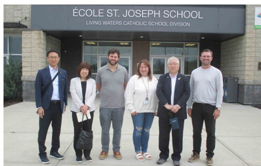
セントジョセフスクール校門前

11月には、町長、議会議長、国際交流推進委員長による公式訪問のほか、町民相互交流事業も再開し、中高校生や一般の方々にニュージーランド・セルウィン町を訪れる予定で、中高校生は、すでに出発に向け事前研修もスタートしています。本町はこれからもホワイトコート町とセルウィン町との友好関係を続け、国際交流を推進していきます。