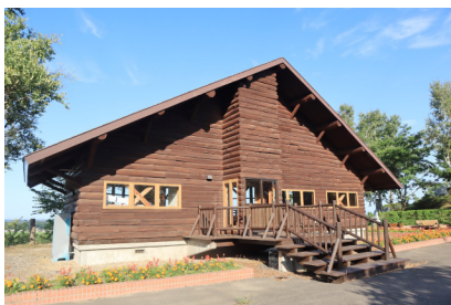
遊具やバーベキューハウスもあり、ご家族で楽しむことができます