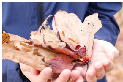
紅葉がきれいなので、この時期になると行きたくなる場所です