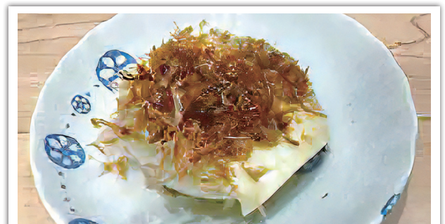
1人分 (玉ねぎ 1/2 個分) *エネルギー: 62kcal *塩分: 0.4g