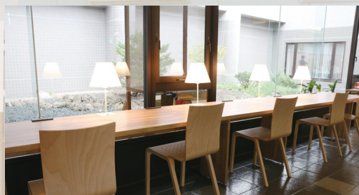
中庭を眺めながら1人1人の空間を過ごせるカウンター席

木の温もり・香りを感じながら、談笑や読書、勉強や仕事など、憩のスペースとしてご活用ください。