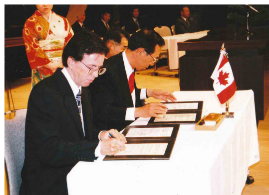
湧別町での調印式

これまでに中高校生をはじめ多くの町民がお互いのまちを訪れ、産業、教育、芸術文化や生活習慣に対する理解を深め、町民同士の友情を育み、調印から本年度で25年の節目を迎えています。