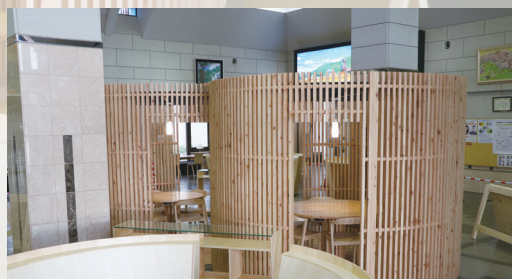
ゆったり過ごせる半個室空間のサークルブース