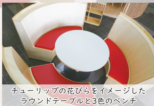
チューリップの花びらをイメージしたラウンドテーブルと3色のベンチ

湧別町は、漁業関係の皆さんを応援しています！ 町民の皆さんもホタテなどの水産物を食べて応援しましょう！