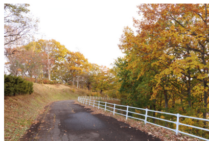
山頂までは急な坂道です。車でも登れますがトレーニングにも…?