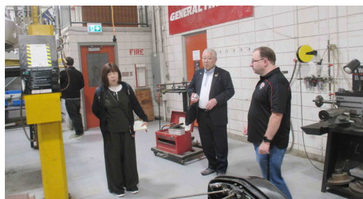
ヒルトップ・ハイスクールでは、通常の授業のほかメディアアート、美容（コスメ）、車両整備などの選択プログラムがあり、高校在籍中に取得できる資格があります。また、バレーボールやアイスホッケーなどのスポーツ活動も盛んです。

セントジョセフスクール、ヒルトップ・ハイスクールの町内2つの高校を訪問し、中高校生の交換留学や短期交流事業の実施について連携していくことを確認しました。