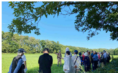
我がまち湧別町のお宝を訪ねる旅に参加

話し合いの中で、「 みそのやま 御園山いいよね～」と話題に。ところが、湧別に長く住んでいる方でも「みそのやま?どこそれ!？」と、認知度が低いことが判明!