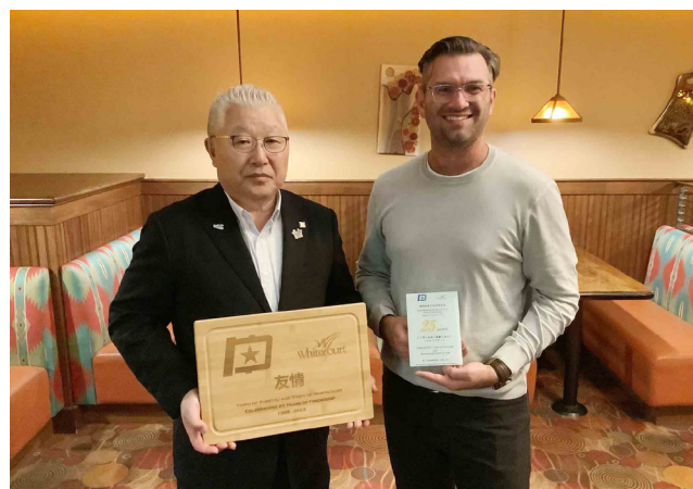
刈田町長とランクトット副町長

新型コロナウイルス感染症の影響により相互訪問がかなわず、交流事業が途絶え5年が経過していたことから、刈田町長などが今後の国際交流の推進に向け、ホワイトコート町を公式訪問し、友好の絆を再確認してきました。