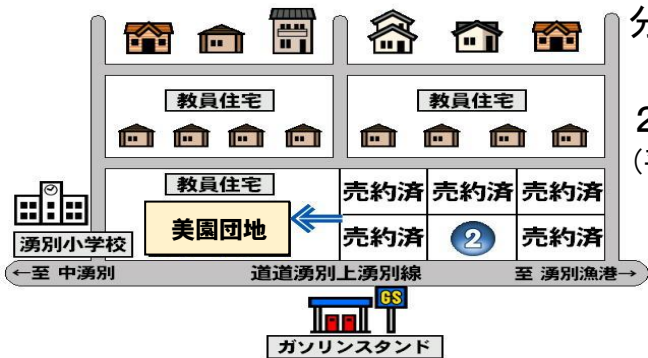
美園団地(錦町) 12,000円/坪

町では、定住促進を目的に造成した宅地を分譲しています。 住宅建設補助事業をご利用いただくと最大200万円の補助があります。 (平成32年3月31日まで)