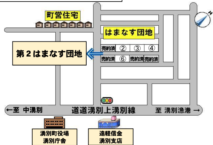
第2はまなす団地(栄町) 17,600円/坪